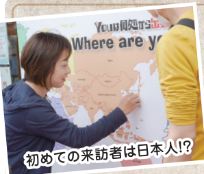
初めての来訪者は日本人!?